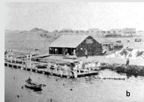
a. Spaanse waterput - b. zwembad in de Leie bij busbeke 1915