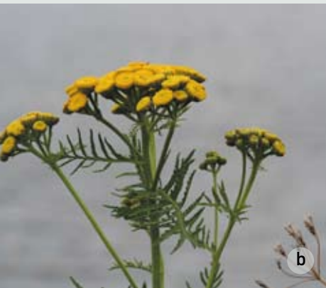
a. buurtweg in Laag Vlaanderen - b. boerewormkruid

We slaan na 350 m in de Busbekestraat links de onverharde buurtweg in. We komen in het gebied van beheersovereenkomsten. De stad Wervik zorgde ervoor dat er een bijko-mende poel werd aangelegd en dat er struiken en bomen (kleine landschapselementen)