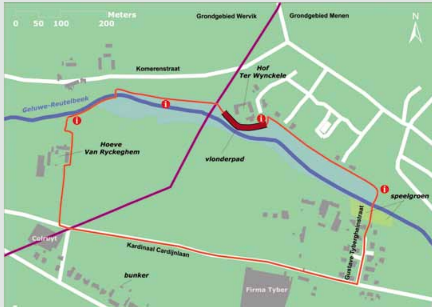
plan educatieve route