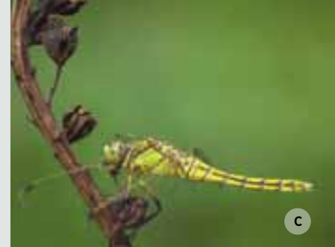
c. Gewone oeverlibel, foto Leander Depypere - d. Steenuil, foto Yves debosscher - e. Hoeve Van Ryckeghem

Naast de vroegere hoeve Delefortrie (zie plannetje Geluwebeek anno 1850) bevinden zich nu de gebouwen van de firma Tyber, opgericht door Gustave Tyberghein. Gustave Tyberghein was een bekend industrieel te Menen. Hij is geboren te Menen op 20 juni 1877 en is er overleden op 29 juni 1957. In 1906 stichtte hij een rubberfabriek in de Busbekestraat in Halluin. In 1930 richtte hij een textielbedrijf op in de Kunstenstraat waar o.a. fluweel werd gemaakt. Eind de jaren 40 werden nieuwe bedrijfsgebouwen opgetrokken langs de leperstraat waar aanvankelijk meubelstof geproduceerd werd om zetels te garneren.