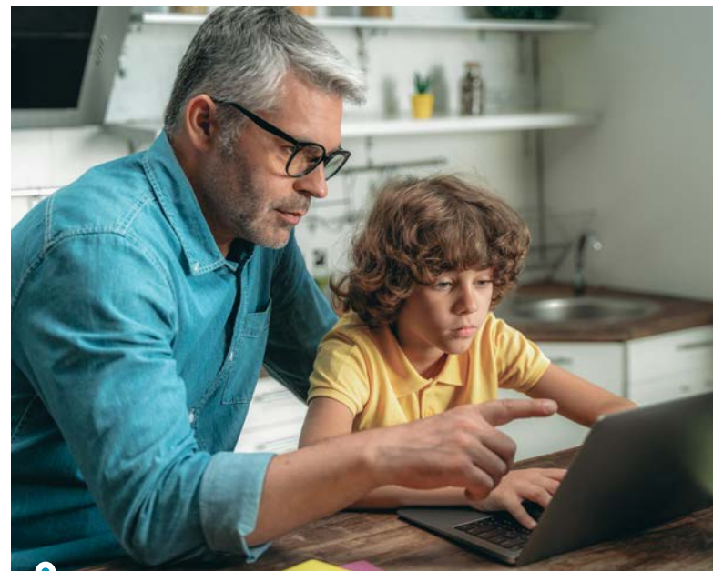
Het is aan jou als ouder om samen met je kind te bespreken wat je ok vindt op welke leeftijd, en hoe je jouw kind daarin begeleidt.