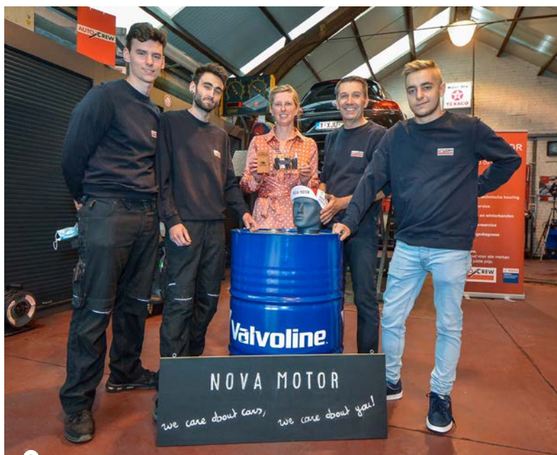
Het ambassadeurschap geeft ons bijkomende energie om er iedere dag vol goesting te staan.

Voor de 3 de keer ging OC West in de campagne 'Ik koop lokaal bij een winkelier van hier' op zoek naar ambassadeurs. 15 handelaars uit Wervik-Geluwe registreerden zich om het gezicht te worden van deze campagne en consumenten mee bewust te maken van het belang van lokaal kopen. Want mensen moeten zich er bewust van zijn dat ze een levendige kern zelf in de hand hebben. Als je veel handelszaken wil, moet je er wel naartoe gaan en lokaal kopen. Het moet een reflex zijn om eerst te kijken wat je binnen je eigen stad kan aankopen.