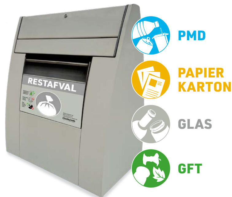
Simulatiefoto van de container voor restafval. Daarnaast zal de ondergrondse sorteerstraat gelijkaardige containers voor PMD, papier & karton, glas en GFT bevatten.

De ophaaldiensten van Mirom Menen zullen instaan voor de lediging van de containers. Aan de sorteerstraat komt ook een camera om toezicht te houden op een optimale sortering en eventueel misbruik vast te stellen. De sorteerstraat zal elke dag open zijn tussen 8 en 20 uur.